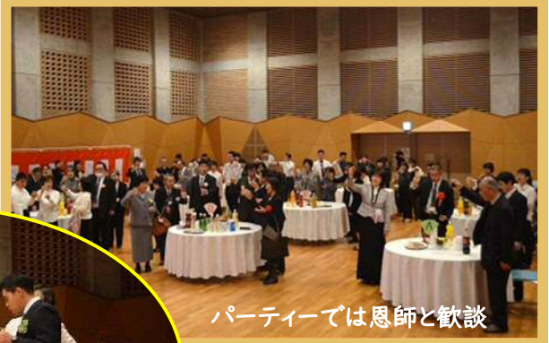
パーティーでは恩師と歓談