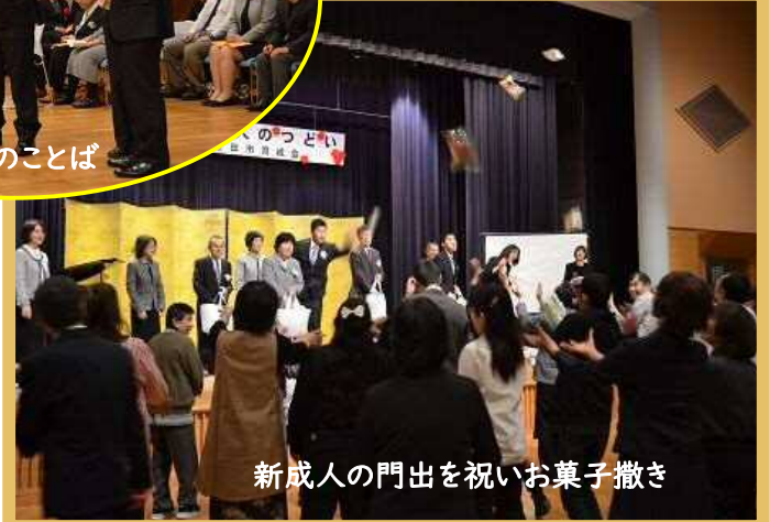
新成人の門出を祝いお菓子撒き