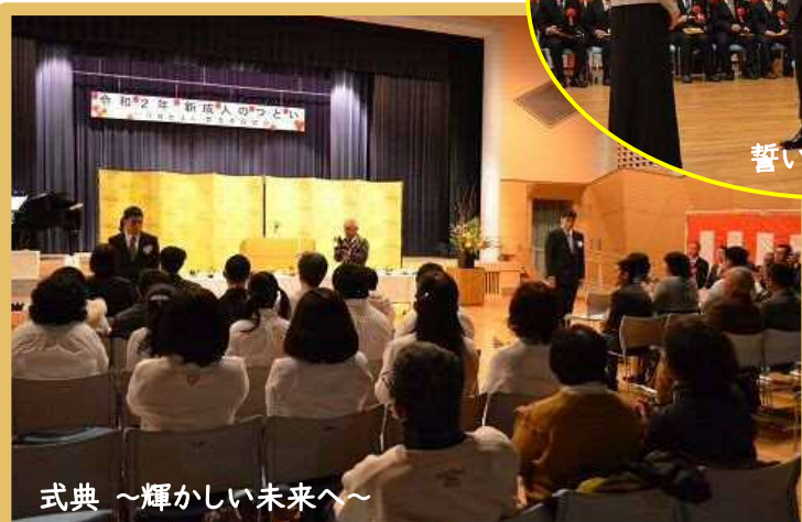
式典 ~輝かしい未来へ~