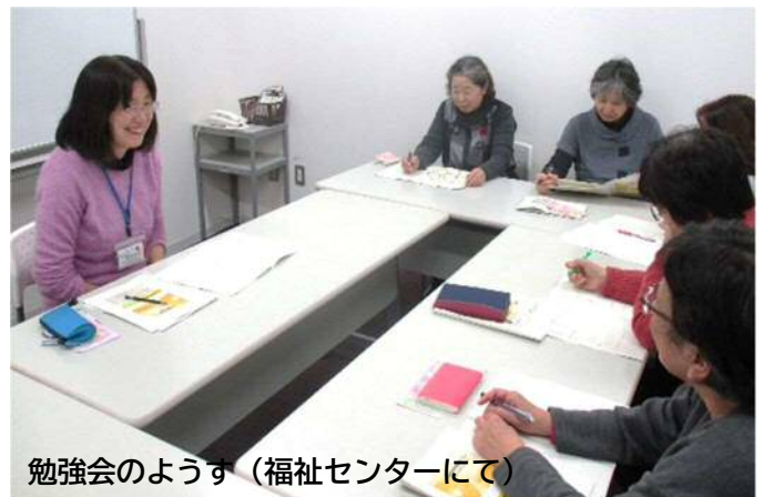
勉強会のような雰囲気 (福祉センターにて)

豊田市成年後見支援センターさん(豊田市福祉センター2階)では、成年後見制度に関する相談をお受けし、弁護士や司法書士、福祉関係機関と連携しながら支援をされています。お困りごとのある方は相談窓口へ足を運んでみてはいかがでしょうか。