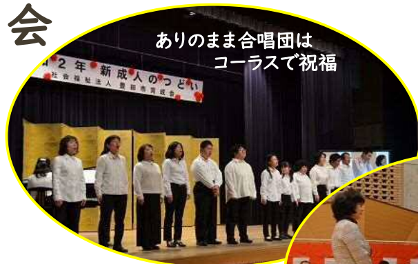
ありのまま合唱団は コーラスで祝福

1月19日(日)西部コミュニティセンター多目的ホールにて、新成人のつどいを開催しました。今回、豊田市育成会からは2名の新成人が大人の仲間入りをしました。当日は、多くの来賓や関係者が見守る中、式典が行われました。式典では、新成人からこれまでお世話になった皆さまへの謝辞と、これからの決意や抱負を力強く述べられました。式典後のパーティーでは、中央支部と高岡支部の皆さんが準備した美味しいお料理を囲みながら、恩師や家族と和やかに楽しい時間を過ごしました。