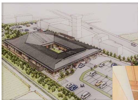
障がい者就労施設 カフェスペースイメージ図