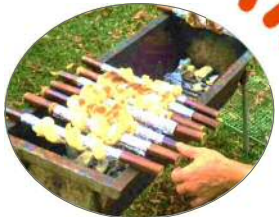
中央支部Tさん お手製の ぐるぐるパン