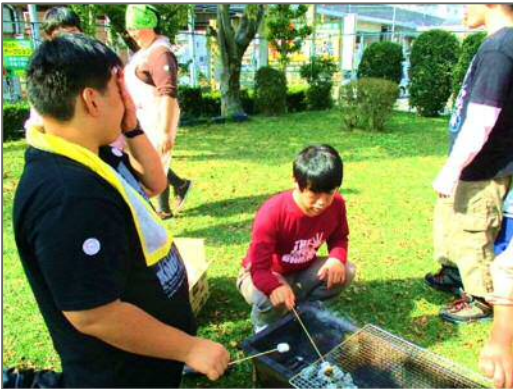
焼き加減をじっと見つめて。。。

----- 昨年は、台風の影響で惜しくも開催を断念したバーベキュー大会。今年は涼しい秋風に吹かれ、高く澄んだ空の下開催することができました。参加者数は総勢67名と大変賑やかな笑顔の溢れる1日となりました。おにぎりづくりや野菜切り等、楽しみながらも自分達で準備を行う姿も印象的でした。ご参加いただきました皆さま、ご協力いただきありがとうございました。全員の協力あってのバーベキュー大会。そこに広がる美味しさは、ひと味もふた味も違うのではないのでしょうか。来年もお楽しみに・・・？