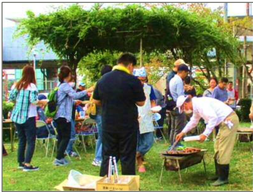
野外で食べるお肉は格別♪