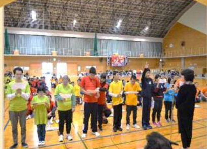
実行委員の代表より選手宣誓!