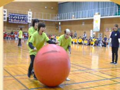
玉を転がせ!大玉転がしに奮闘!!