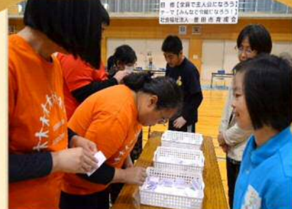
何が出るかな!福引競争 なんとスペシャル賞品もある!