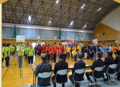
全員整列! さあ! 頑張るぞー!

秋晴れの11月9日(土)、豊田市運動公園体育館(高町)にて、令和になって初めての楽楽運動会を開催しました。来賓の皆さんや保護者の見守る中、大玉転がしや福引競争等4つの競技を利用者全員力いっぱい楽しみました。最後は、参加者全員でパプリカを踊り親睦を深めました。