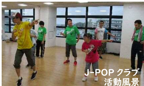
J-POP クラブ 活動風景

平成29年度からクラブ活動として新しくスタートしました。毎月第1土曜日にサン・アビリティーズ豊田で活動しています。(月によって育成会本部)楽しい仲間たちとレッツダンス!音楽に合わせて楽しく踊ってみませんか。 ※現在は定員超過のため募集はしていません