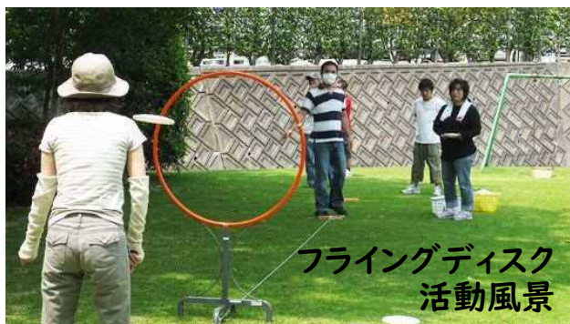
フライングディスク 活動風景

第4土曜日の9時30分よりサン・アビリティーズ豊田の芝生で活動しています。ディスクキャッチや的入れ練習を日々行い、春と秋の競技大会に出場し優勝を目標に頑張っています。