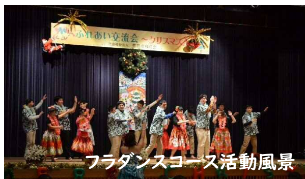
フラダンスコース活動風景

毎月2回、豊田市青少年センターにてフラダンス講師のもと活動しています。女性だけでなく男性も楽しむことのできる、ハワイの伝統的な歌舞音曲です。毎年12月に開かれるふれあい交流会での発表に向けて練習に力を入れています。