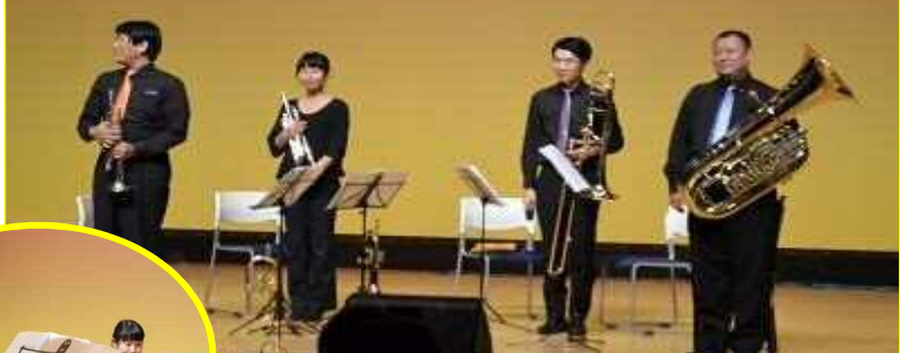
スペシャルゲスト☆かるくらカルテット