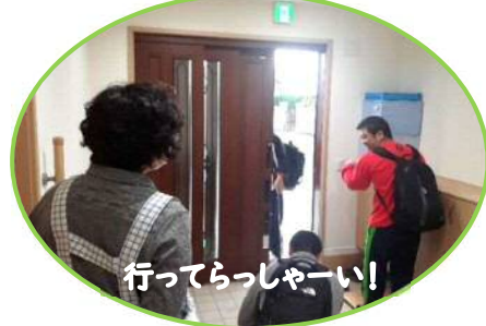
行ってらっしゃーい！