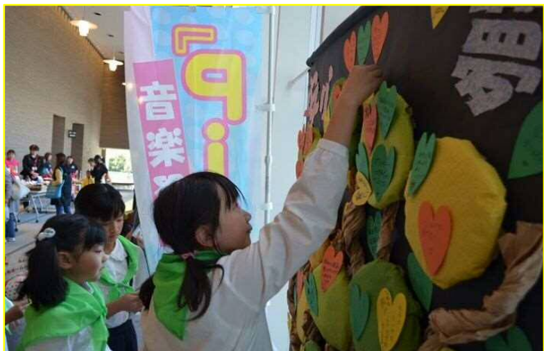
交流コーナーでは、「安心」「夢」「笑顔」に因んだメッセージ カードを壁画に貼り、安心・夢・笑顔の大きな木を製作しました。