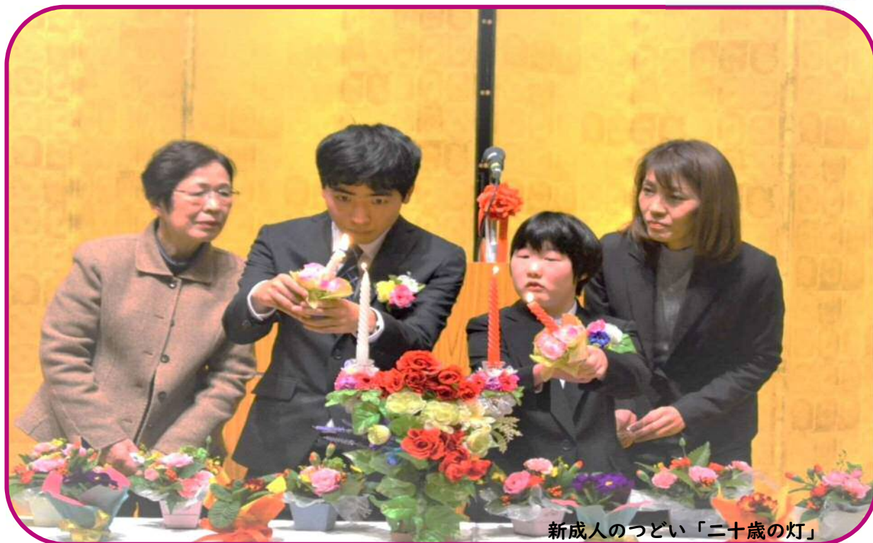
新成人のつどい「二十歳の灯」

発行 社会福祉法人豊田市育成会 〒471-0831 豊田市司町3丁目6番地1 TEL 0565-77-5611 FAX 0565-77-3557 E-mail t-ikuseikai@hm.aitai.ne.jp URL http://t-ikuseikai.jp