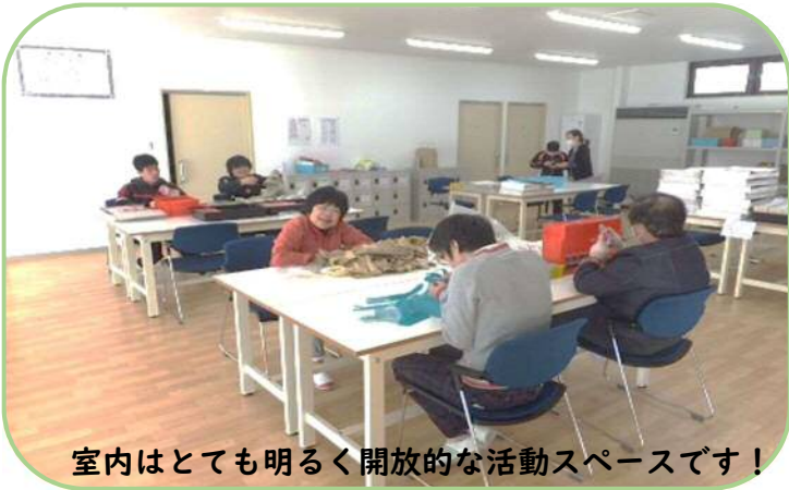
室内はとても明るく開放的な活動スペースです！