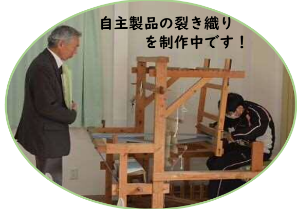
自主製品の裂き織りを制作中です！