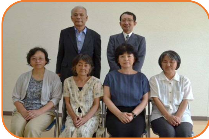
新しい理事の皆さん

6月10日開催の評議員会において新しい理事・監事が選任し、理事会にて理事長と常務理事を互選しました。任期は、平成29年6月定時評議委員会選任日から平成31年6月の定時評議員会終結日までです。