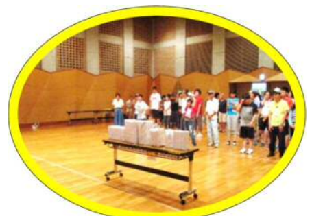
賞品にワクワクドキドキ☆