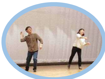
親子で大盛り上がり