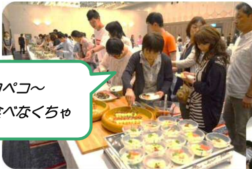
おなかペコペコ～ たくさん食べなくちゃ