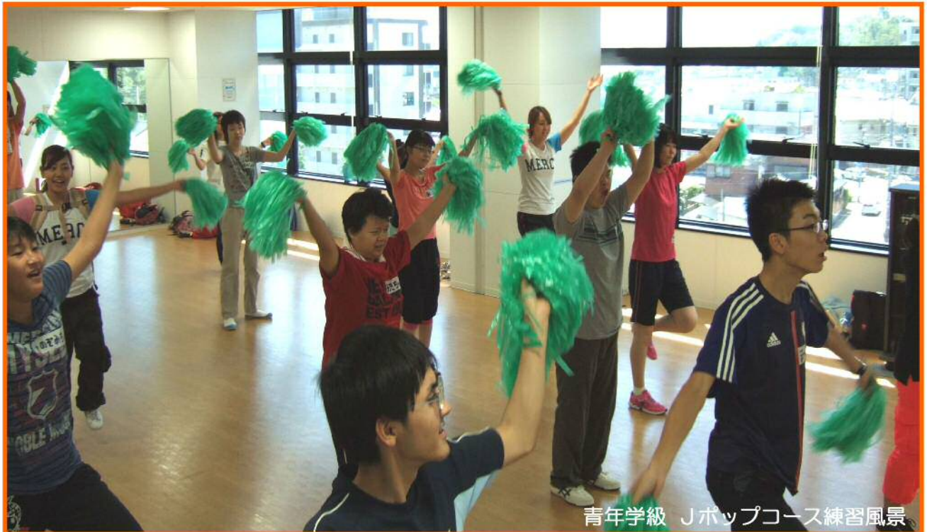
豊田市育成会の本人活動

本人活動は、知的障がいのある本人が自主的に集まり、様々な活動を通して自信や誇りを確立しようとする活動です。豊田市育成会では、福祉啓発事業の3本柱の1つに本人部会を置き、本人活動を支援しています。本人部会の委員は、講座及びクラブ等の代表者の本人7人と保護者6人の13人で構成されており、本人の意見を大切にして事業を展開しています。情報が溢れ、進歩が早く複雑な現代社会において、地域で「安心してすごせる」「夢や願いがかなう」「笑顔が絶えない」生活を送るために必要なノウハウをいろいろな活動を通して学びます。