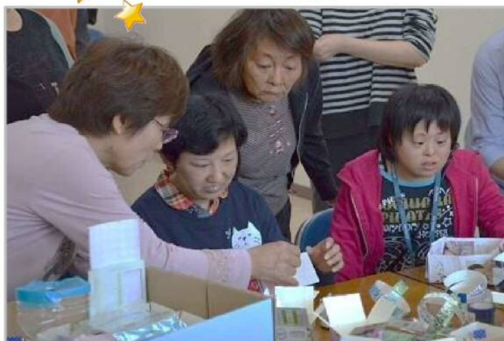
柴田支部長(猿投)が丁寧にレクチャーします！

じゃんけんゲームでは西支部長(中央)と参加者全員でじゃんけんポン！最後に勝ち抜いたのは高橋支部 橋本さんでした！