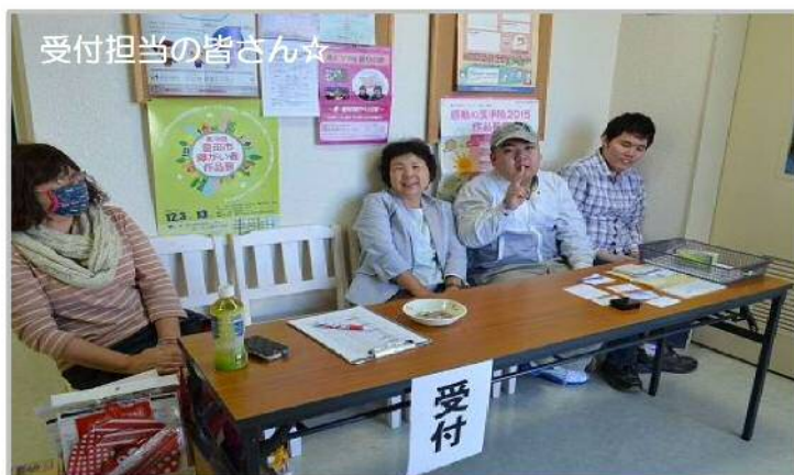
受付担当の皆さん☆

10月25日(日)、会員の交流を目的に5支部の正副支部長が協力し合い『ものづくり&ゲーム大会』をつかさ本部2階で行いました。当日はいろんなゲームコーナーや工作ブースから大きな歓声が上がリ、会員同士交流を深めました。