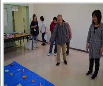
輪投げで景品ゲット！