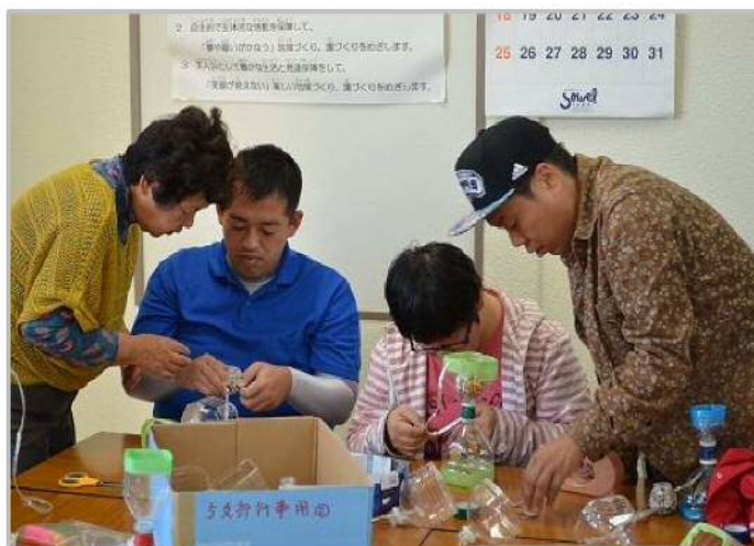
工作ブースではペットボトルでけん玉作りです！