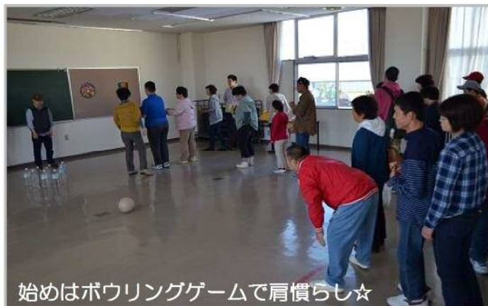
始めはボウリングゲームで肩慣らし☆