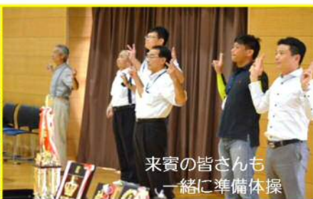
来賓の皆さんも一緒に準備体操