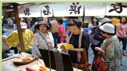
黒壁スクエアでお買い物