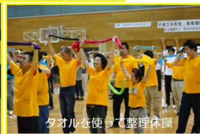
タオルを使って整理体操