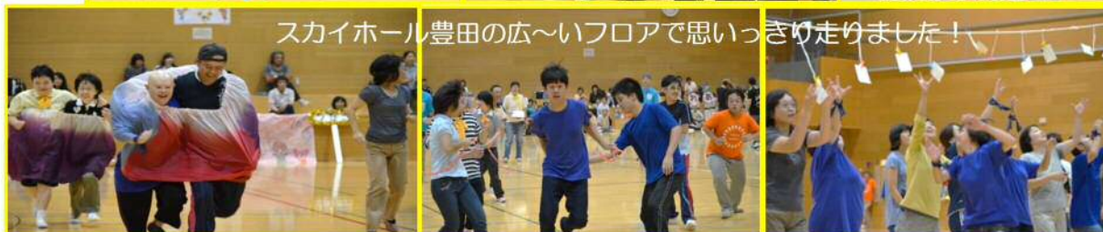
スカイホール豊田の広〜いフロアで思いっきり走りました!