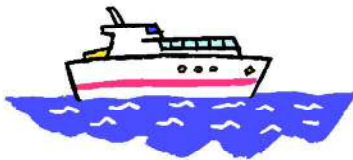
フェリー乗船！ 風が気持ち良かったね♪