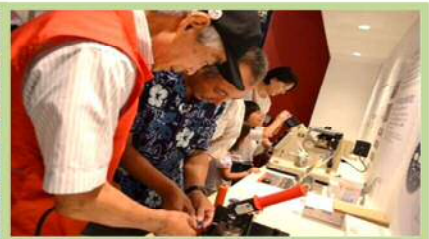
ヤンマーミュージアムで缶バッチ作り！

晴天の9月14日(日)、今年の育成会会員バス旅行は、総勢70名の皆さんと滋賀県の「黒壁スクエア」と、琵琶湖に浮かぶパワースポット「竹生島」へ行きました。黒壁スクエアでショッピングを楽しみ、長浜ロイヤルホテルのランチバイキングで美味しい料理を堪能し、フェリーで竹生島へ渡りゆっくり散策しました。