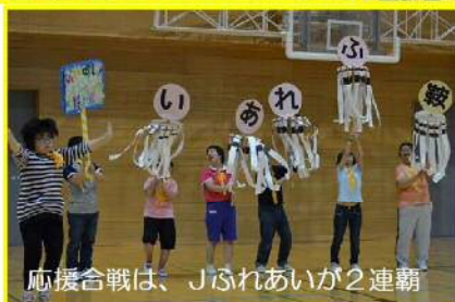
応援合戦は、Jふれあい2連覇