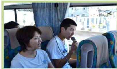
バスの中ではカラオケ大会！