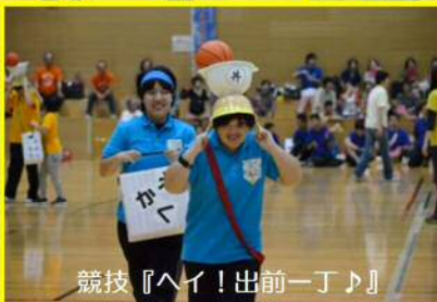
競技『ヘイ!出前ー丁♪』