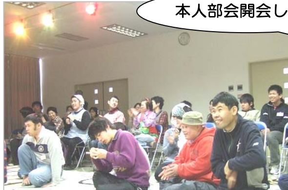
本人部会開会します