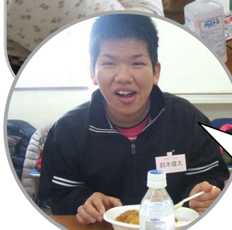
カレーライス とてもおいし いよ!