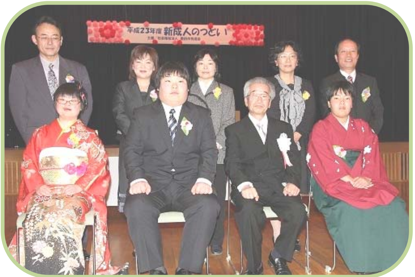
新成人のつどいにて