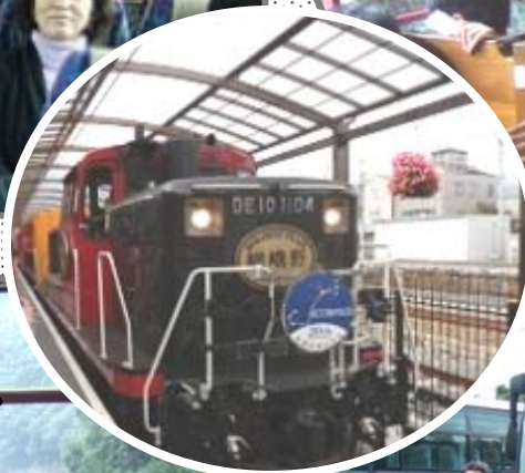
保津川下りを眺めたり・・・。