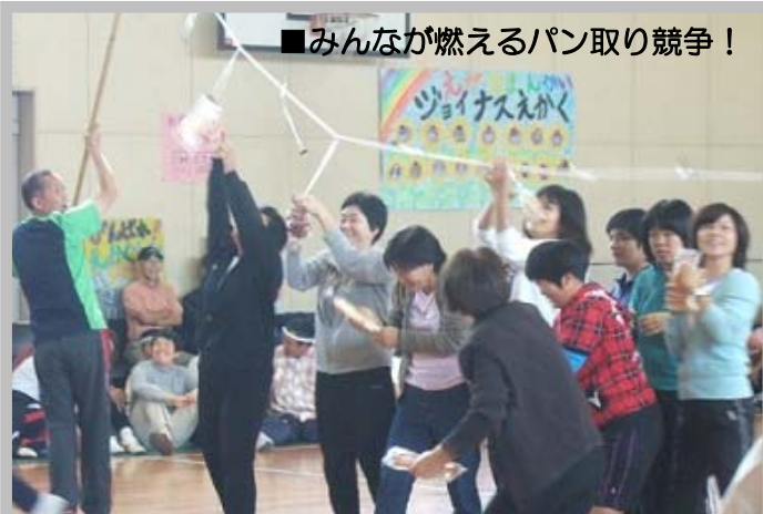
■みんなが燃えるパン取り競争!