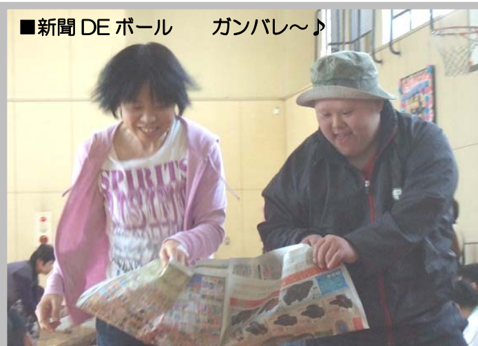
■新聞DEボール ガンバレ〜♪