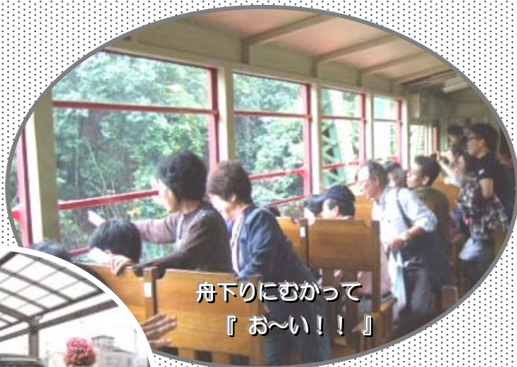
舟下りにむかって『お〜い!!』