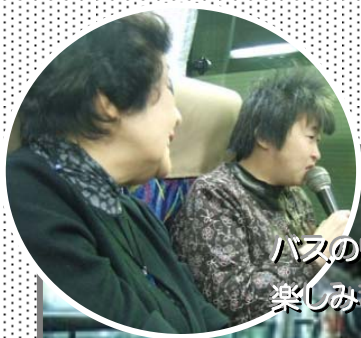
バスの中ではゲームやカラオケを楽しみました♪

11月6日(日)、恒例の育成会日帰りバス旅行に行ってきました。今年は総勢84名の参加で、みんなで一緒にトロッコ電車に乗り、楽しく秋の京都を満喫しました。