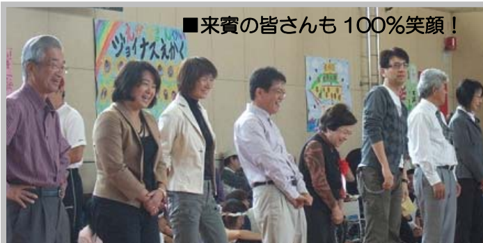
■来賓の皆さんも100%笑顔!