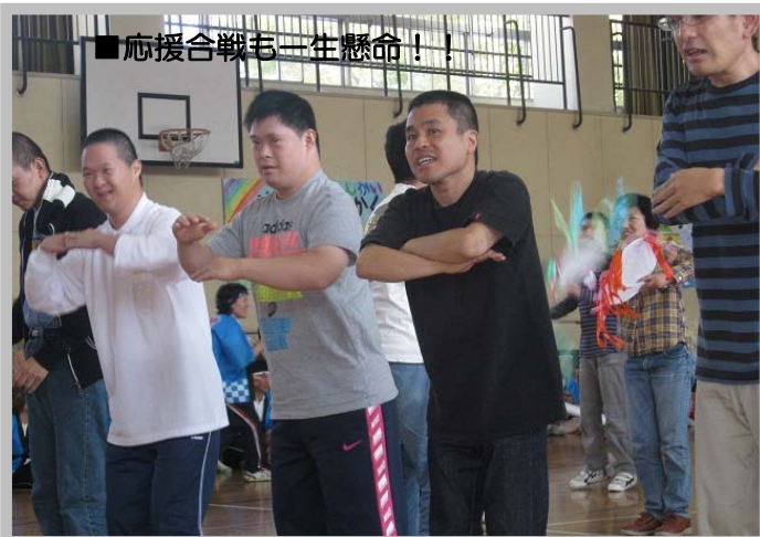
■応援合戦も一生懸命!!